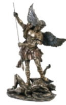
Miguel de Bronze