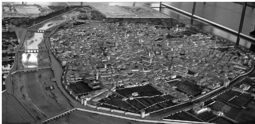
Maqueta del plànol del pare Tosca al vestíbul del MUVIM.

seguint-li les petjades als grecs i necessitaven més assentaments en el litoral mediterrani occidental. Els romans, victoriosos en la Segona Guerra Púnica, on la resistència heroica de Sagunt el 219 AP li havia costat molt cara, van emprendre una campanya militar i colonitzadora que, pel que ens afecta, va comportar la fundació de València.