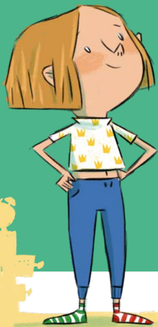
Il·lustració: Ona Causa