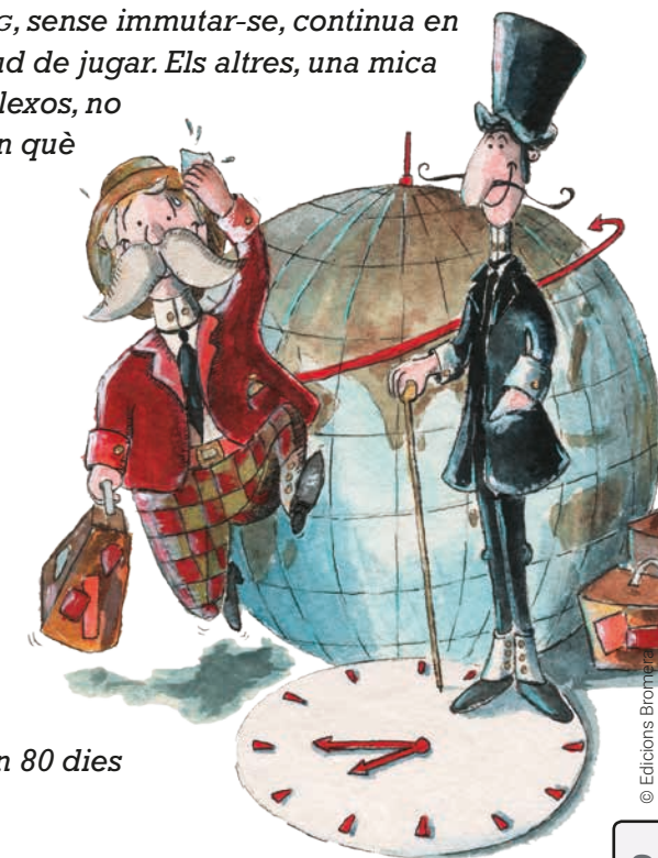
JULES VERNE. La volta al món en 80 dies

(FOGG, sense immutar-se, continua en actitud de jugar. Els altres, una mica perplexos, no saben què fer.)